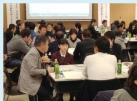
“高校生と大学生がディスカッション”

2月11日と12日の2日間、金沢商工会議所にて、本学高大接続ラウンドテーブル実行委員会は「金沢大学高大接続ラウンドテーブル（第1回）－〈探究〉と〈研究〉を結ぶ入試をデザインする－」を開催し、学内外から高校生、高校教員、学生、大学教職員ら120名以上が参加しました。