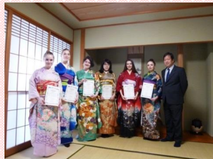
“最終日、着物体験にて”

2018年2月、ロシアのカザン連邦大学、イルクーツク大学、クラスノヤルスク医科大学からの学生6名が、文化交流プログラムに参加するため、金沢大学にやって来ました。到着日は、金沢が歴史的な大雪に見舞われた日で、さすがのロシア人留学生も、雪の多さに圧倒されていたようでした。参加者は、3週間に渡り、兼六園・金沢城をはじめ、石川県伝統工芸美術館、金沢くらし博物館、大乗寺といった金沢を代表する場所を巡り、金沢の生活を満喫しました。また、金箔貼りや和菓子作りも、挑戦しました。その後留学生たちは、日本人学生と一緒に、五箇山のフィールドトリップに参加しました。合掌村の構造と日本の昔の生活スタイルが、とても印象深かったようです。プログラムの最終日には、女子学生全員が素敵な着物姿で、記念撮影を行いました。みなさん、着物がよくお似合いです！