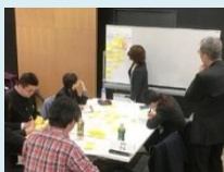
“グループディスカッションの様子”

2日間を通して熱心な協議が繰り返され、参加者らに高大接続システム改革への強い関心を呼び起こす契機となりました。