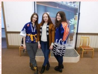
“プログラムでの様子”

参加した学生からは、「このプログラムは、私の夢が実現された最高の機会でした。すべては私の期待どおりでした！たくさんの方の体験し、忘れられない思い出を作ることができました。また、私の日本語能力も向上にもつながり、視野が広がりました。」「このプログラムの思い出は、一生の宝物です。おかげで、たくさんの方のことに気づかされ、未来の目標が明確になりました。」といったコメントが寄せられました。