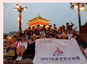
"With Xidian University students"

There are many opportunities to interact with Chinese students in this program. Particularly in Xi'an, one Chinese student is assigned to one Japanese student, and spend most of the activities together as a pair. I saw both Japanese and Chinese students teaching each other about their University life, language and so on for so many times.