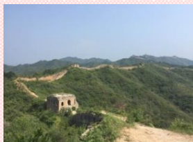
"the Great Wall Box House"

One of the features of this program is that you can visit numerous historical spots of Beijing and Xi'an. Especially, I recommend you the Great Wall Box House (Beijing). It has been