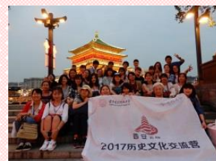
“西安電子科技大学の学生と”

本プログラムでは、協定校の学生と触れ合える機会を多く設けました。特に西安では、西安電子科技大学日本語系の学生と、本学の学生が一对一のペアとなって、世界遺産の参観から発表会、食事、買い物まで、日程のほとんどにおいて行動を共にしました。日本と中国それぞれの大学生活や言語などについて教え合う様子が見られました。